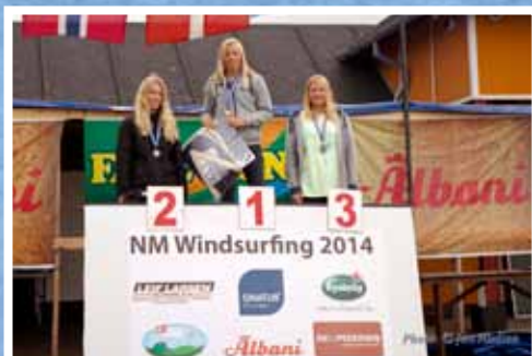
Natasha nr. 2 til NM

Vi fik sejlet 3 sejladsere på 3 dage, der var ikke meget vind. Se hjemmesiden med alle resultaterne.