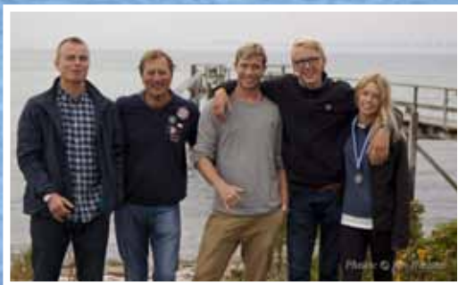
Team Nivå i Nyborg