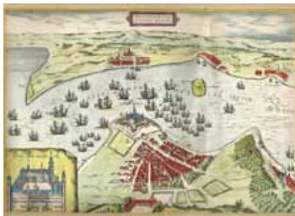
Norra delen av Öresund. Braun & Hogenberg 1588.

hvorledes historien er bag de mange havne og kystbyer vi fra Nivå har som nærmeste naboer.