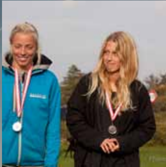
Natasha nr, 2 NM