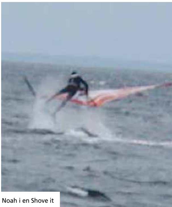
Noah i en Shove it