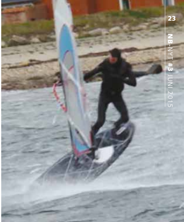
Vulcan udført af Jonathan