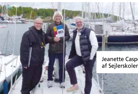
Jeanette Caspers har fanget nogle af Sejlerskolens mange ansigter